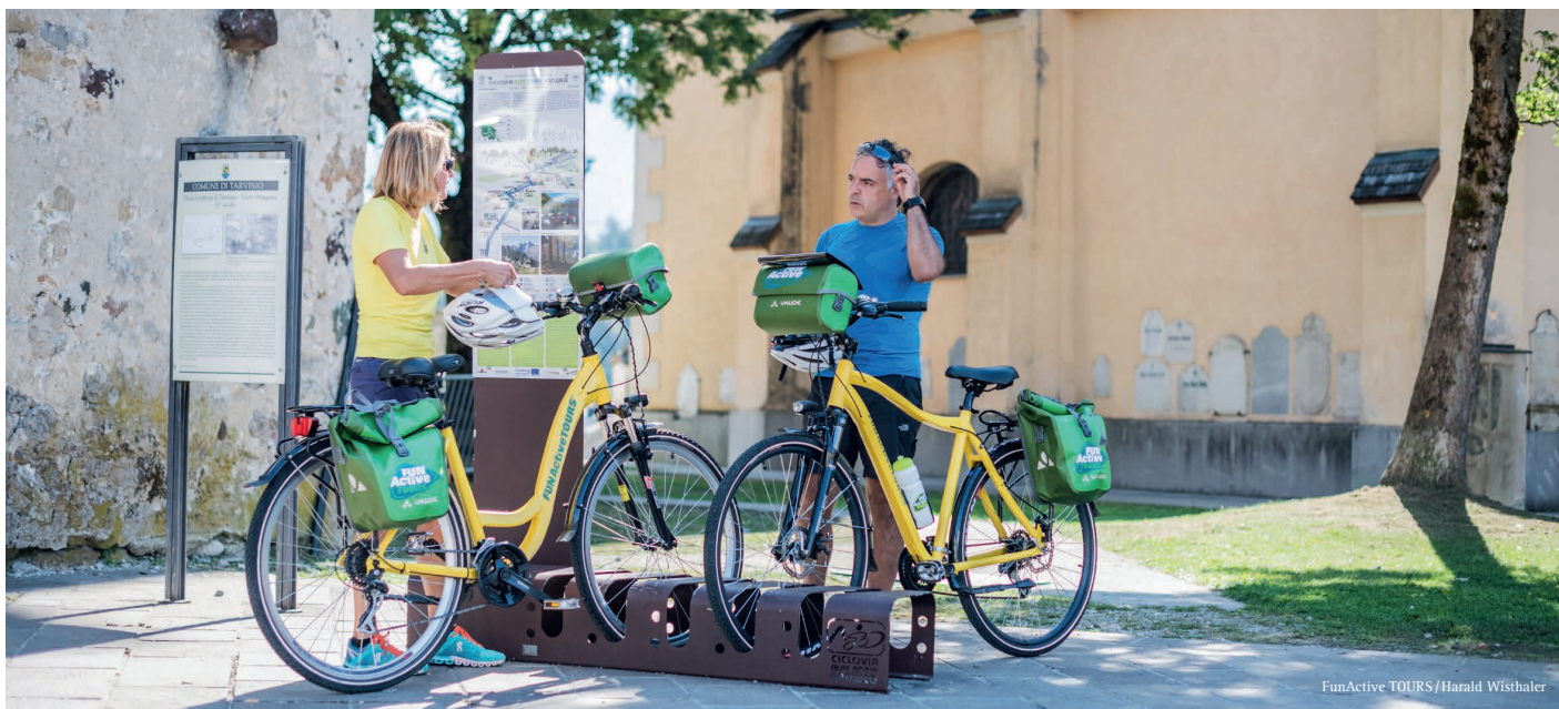
FunActive TOURS / Harald Wisthaler