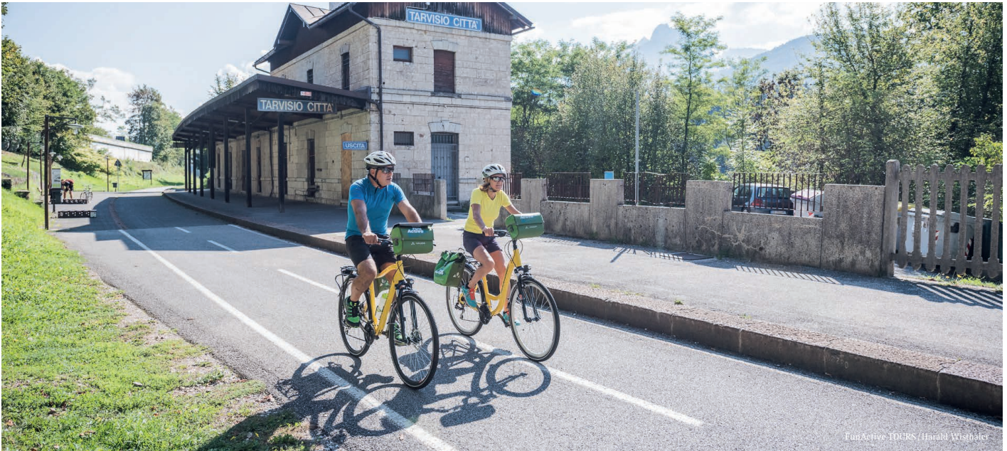
FunActive IDERS / Harald Wieshofer