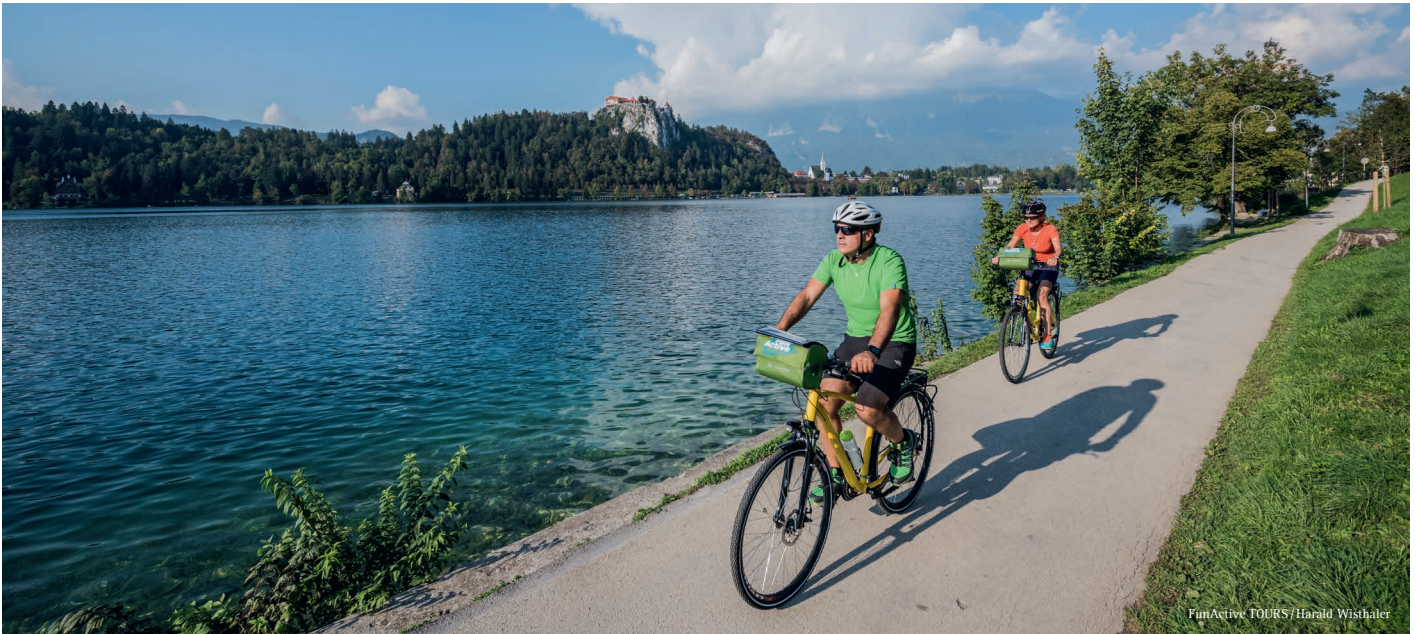
FunActive TOURS / Harald Wisthaler